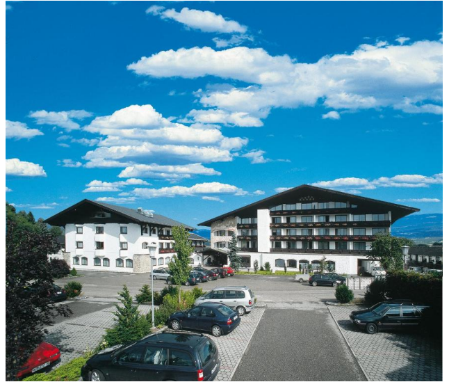
Hotel Lohninger-Schober in Hipping